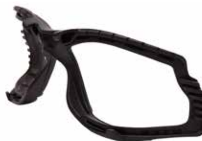
71511-99999 Wkładka piankowa