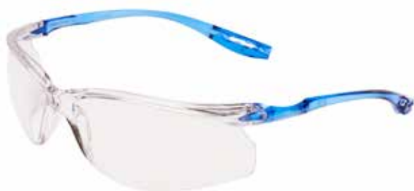
71511-00000 Soczewki: Bezbarwne