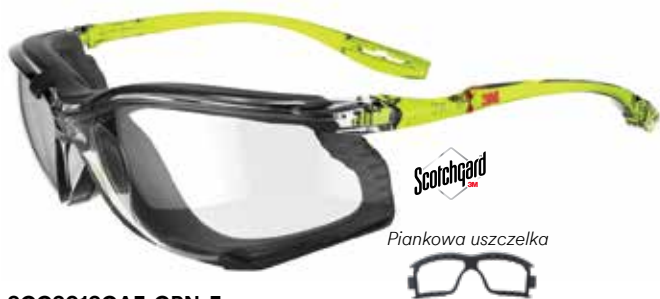
SCCS01SGAF-GRN-F Soczewki: Bezbarwne