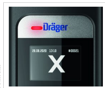
Symbol wykrycia alkoholu