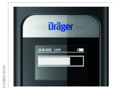
Symbol badania w toku