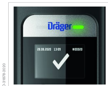
Symbol braku wykrycia alkoholu