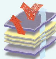
Tylny panel SMMMS.

Duży, niebieski tylny panel składa się z 5 warstw polipropylenu (polipropylenu w technologii spunbond i meltblown), nadając mu doskonałe właściwości oddychające i zachowując przy tym poziom ochrony typu 5/6.