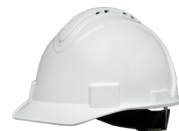
Hełm ochronny z krótkim daszkiem Honeywell North, wentylowany Nr katalogowy: NSB11001E