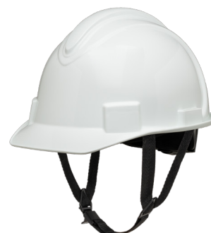
Pasek pod brodę NSB100CS