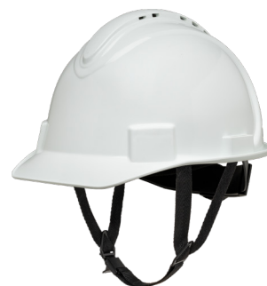
Pasek pod brodę NSB100CS