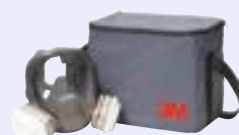
Torba do noszenia masek pełnych 3M™ 107