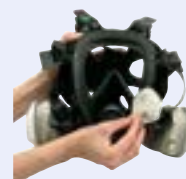
Ściereczka do wycierania uszczelki twarzy 3M™ 105