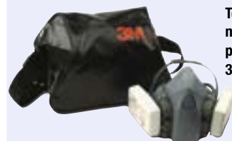
Torba do noszenia półmasek 3M™ 106