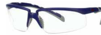
S2001ASP-BLU Soczewki: Bezbarwne | Kolor oprawki: Niebiesko/szara